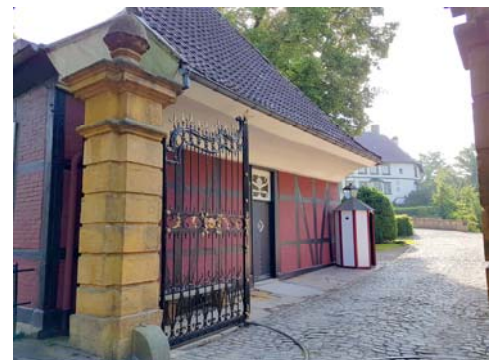
Bild 1 Der Standort ift West – Die „Alte Wache“ am Schloss Rheda-Wiedenbrück

Aus diesem Grund bietet das ift Rosenheim das Seminar „Fensterpraxis“ an. Die ift-Referenten veranschaulichen die aktuellen Anforderungen und zeigen praxistaugliche Lösungen.