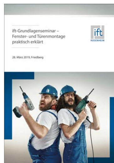
Bild 1 „Fenster- und Türenmontage praktisch erklärt“ am 28. März 2019 in Friedberg bei Augsburg

Nach einer Einführung zu den wesentlichen Anforderungen und Regelwerken an die Montage hinsichtlich Befestigung, Abdichtung, Wärme- und Schallschutz werden anhand unterschiedlicher Einbausituationen in Theorie und Praxis die Vor- und Nachteile der unterschiedlichen Montageausführungen aufgezeigt.