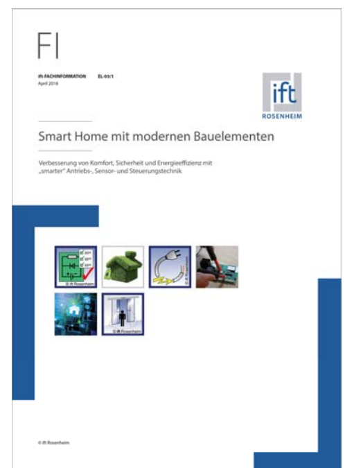
Bild 1 ift-Fachinformation EL 03/1 „Smart Home mit modernen Bauelementen“

Um die Branche bei dieser Aufgabe zu unterstützen hat das ift Rosenheim die Fachinformation EL-03/1 „Smart Home mit modernen Bauelementen“ erarbeitet. Auf 22 Seiten wird kurz, übersichtlich und gut verständlich die komplexe Thematik vorgestellt. Mit übersichtlichen Grafiken und Tabellen sowie Checklisten und Praxistipps hilft die