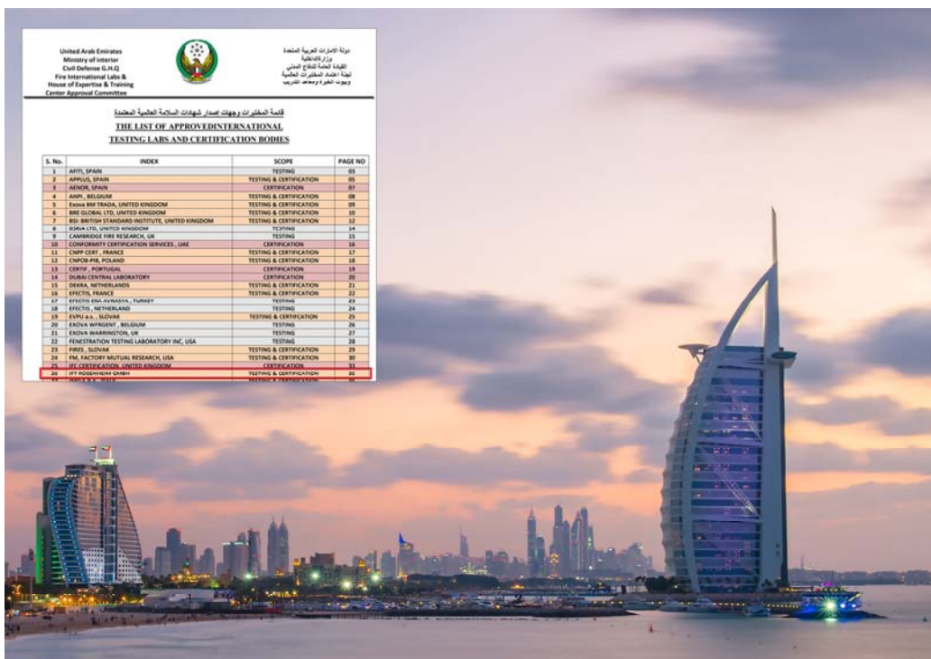
Bild 2 Durch die Anerkennung von ift-Prüfungen und -Zertifizierungen wird der Einsatz europäischer Brandschutzelemente in den Vereinigten Arabischen Emiraten einfacher

Die internationale Stellung des ift Rosenheim wurde in den Vereinigten Arabischen Emiraten (VAE) durch die Anerkennung des „ Civil Defence Department “ für Prüfung und Zertifizierung von Bauprodukten mit Brand- und Rauchschutzanforderungen sowie die Kooperation mit der kanadischen Prüf- und Zertifizierungsstelle „Quality Auditing Institut (QAI)“ ausgebaut. Das ift Rosenheim führt als Inspektionsstelle für QAI den größten Teil der Überwachungen von Bauprodukten in Europa durch, so dass die Abwicklung vereinfacht wird und sich preisliche Vorteile durch reduzierte Reisekosten ergeben.