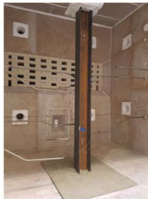
Säulenprüfstand (Column Furnace) 3 m × 3 m × 3 m, Prüfung nach ETK-, UL-, HC- und RWS-Kurve, belastet/unbelastet bis 500 Tonnen