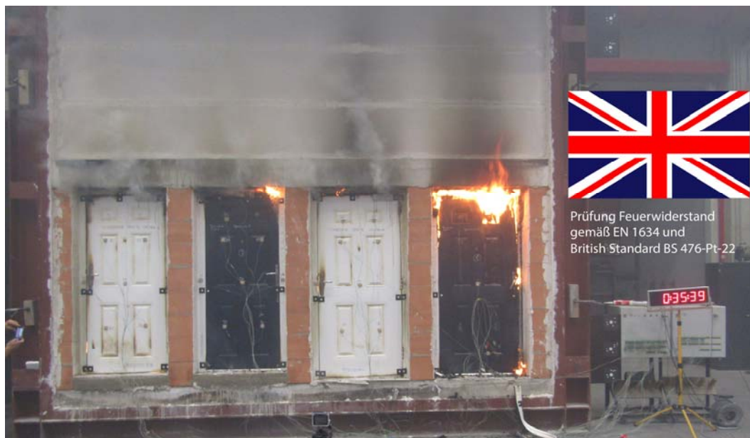
Bild 4 „Im Auftrag Ihrer Majestät“ werden im Rosenheimer Brandschutzzentrum 100 Türen auf Feuerwiderstand gemäß EN 1634 und British Standard BS 476-Pt-22 geprüft.

rade werden vom ift Rosenheim und UL „im Auftrag Ihrer Majestät“ 100 Türen auf Feuerwiderstand gemäß EN 1634 und British Standard BS 476-Pt-22 geprüft. Die Türen wurden als Stichprobe direkt aus dem Handel gezogen. Die Britische Regierung will damit die tatsächliche Feuerwiderstandsdauer handelsüblicher Produkte feststellen, um eine fundierte Basis für Änderungen bei Überwachung und Zertifizierung von Brandschutzelementen zu erhalten. Durch die flexible Akkreditierung des ift Rosenheim und die modernen Prüfeinrichtungen des ift-Brandschutzzentrums konnten und können vier Türelemente gleichzeitig nach den speziellen britischen Prüfbedingungen geprüft werden, damit der enge Zeitplan erfüllt werden kann.