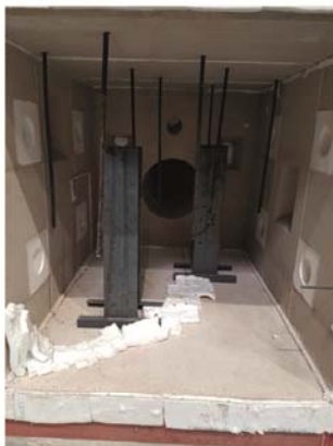
Kleinprüfstand (Small Scale Furnace) Vertikal (1,5 m × 1,5 m), Horizontal (1,5 m × 2 m) Prüfung nach ETK-, UL-, HC- und RWS-Kurve, unbelastet.