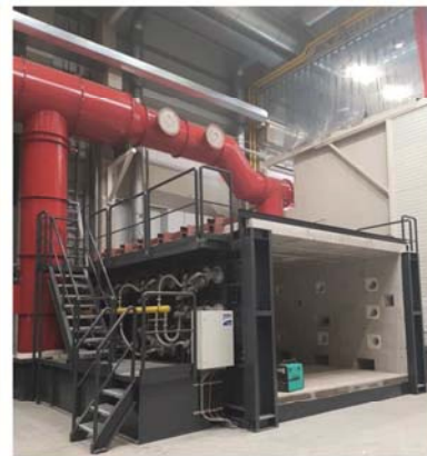
Kombi-Prüfstand (Floor Furnace) Prüfungen an horizontalen (5 m × 4 m) und vertikalen (4 m × 2,5 m) belasteten/unbelasteten Bauteilen nach ETK-, UL-, HC- und RWS-Kurve. Belastung mit 16 Zylindern á 5 Tonnen oder 10 Zylindern á 10 bzw. 20 Tonnen

Bild 5 Neue Prüföfen komplettieren das Angebot im Rosenheimer Brandschutzzentrum