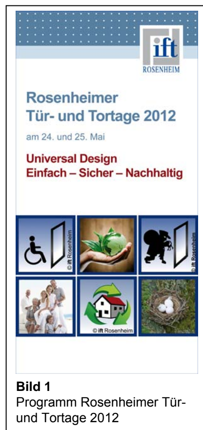
Bild 1 Programm Rosenheimer Tür- und Tortage 2012

Der demographische Wandel und neue Lebensstile zwingen zur unkomplizierten Bedienung und flexiblen Nutzung von Häusern, Räumen und Bauteilen. Die Trends Nachhaltigkeit, Umweltfreundlichkeit und zukunftsgerichtetes Bauen fordern die Branche – sei es bei Gesetzen und Normen, der