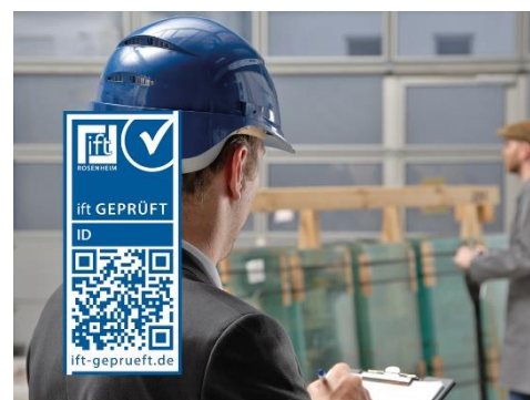
Bild 1 Mit dem „ift-geprüft“-Zeichen können Planer, Händler, ausschreibende Stellen und Endverbraucher die Echtheit von Prüfnachweisen einfach kontrollieren.

In den Medien und auch im persönlichen Umfeld erfahren wir alle regelmäßig, wie häufig Daten und Dokumente gefälscht und manipuliert werden. Deshalb schwindet allgemein das Vertrauen in Informationen, aber gleichzeitig steigt auch die Kompetenz der Menschen bei der Bewertung von Informationen und deren Quellen. Davon ist der Baubereich natürlich nicht ausgenommen. Daher hat das ift Rosenheim ein Verfahren entwickelt, mit dem jeder Käufer von Baustoffen, Bauelementen und persönlichen Schutzausrüstungen (FFP2-Masken etc.) die Echtheit von ift-Nachweisen und Prüfberichten überprüfen kann. Das ift-geprüft-Zeichen zeigt, dass eine oder mehrere Eigenschaften eines Produktes vom ift Rosenheim geprüft und bewertet wurden. Planer, Händler, ausschreibende Stellen und Endverbraucher können damit sicher sein, dass die mit dem Zeichen versehenen Produkte von einem international angesehenen Prüfinstitut unabhängig, kompetent und nach aktuellem Stand der Normen geprüft wurden.